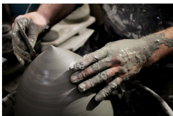
Ceramiche di Grottaglie TA Dicembre 2023