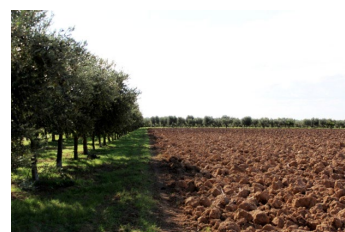
Uliveto Taranto Novembre 2023