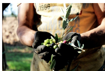
Uliveto Taranto Novembre 2023