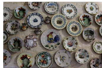
Ceramiche di Grottaglie TA Dicembre 2023