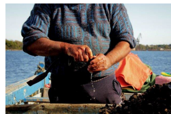
Circummarpiccolo Taranto Novembre 2023