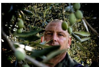
Uliveto Taranto Novembre 2023