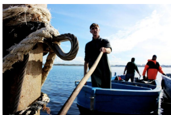
Circummarpiccolo Taranto Novembre 2023