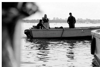
Circummarpiccolo Taranto Novembre 2023

a livello Internazionale. Per i giovani tarantini è stata l'occasione di comunicare emozioni e pensieri in libertà, attraverso il mondo delle immagini. Guidati da un Collettivo di fotografi professionisti hanno potuto esplorare le eccellenze e le tradizioni legate al duro lavoro manuale e a contatto con la natura, simbolo di un territorio che sa catturare il cuore e i sensi”.