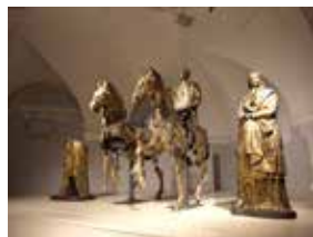
BRONZI DORATI DI PERGOLA