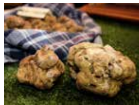
TARTUFO DI ACQUALAGNA

Le Valli del Metauro e del Cesano dialogano con la città di Fano come un'unica destinazione, viva e plurale, entro cui si instaura la capacità di generare esperienze uniche per gli ospiti.